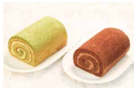
抹茶生チョコロール・生チョコロール

バレンタインデーというと、トリュフや小さくて可愛らしい チョコレートのイメージがありますが、ご家族やご友人 とお楽しみ頂けるホールタイプのチョコレートケーキもご 用意いたします。パーティー気分楽しいバレンタイン デーをお楽しみください。