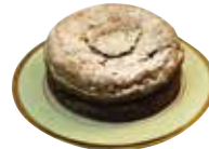
クラシックショコラ